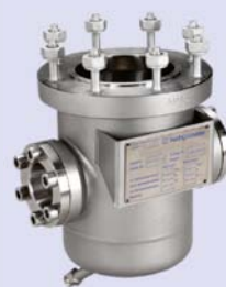
Type 4 Metal vessel with heating jacket, 2 sight glasses and drain valve

Typ 3 Metallgefäß mit Heizmantel und Bodenventil