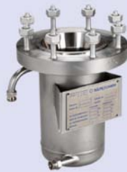
Type 3 Metal vessel with heating jacket and drain valve

Vessels with oil jacket Gefäße mit Heizmantel für Öl