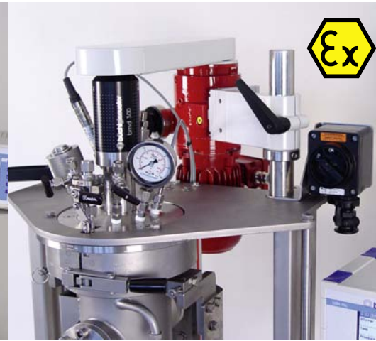
ATEX agitator drive ATEX Rührantrieb