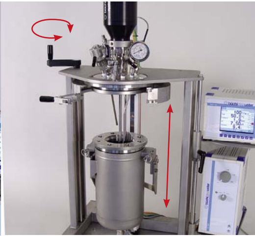
Vessel lift Gefäßlift