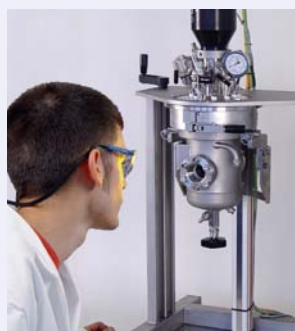
Visual supervision of reaction through sight glass Visuelle Überwachung der Reaktion durch Schauglas