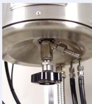
Flush mounted drain valve Tottraumfreies Bodenventil