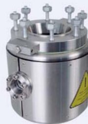
Type 4E Metal vessel with heating jacket, 2 sight glasses and drain valve

Typ 3E Metallgefäß mit Heizmantel und Bodenventil