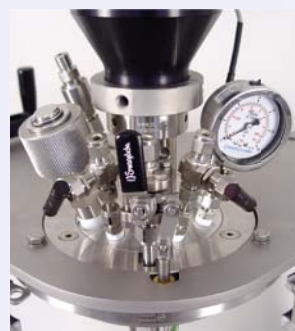
Cover plate with 7 openings Deckelplatte mit 7 Öffnungen