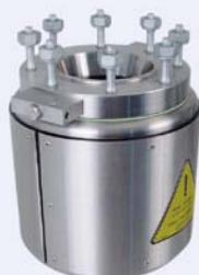
Type 3E Metal vessel with heating jacket and drain valve

Vessels with electric heating / cooling Gefäße mit Elektroheizung / Kühlung