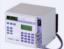
btc temperature controller btc Temperaturregler

ATEX execution optional ATEX-Ausführung optional