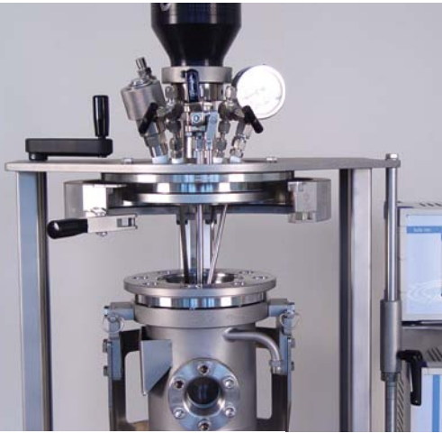
Fast Action Closure (FAC) Schnellverschluss (FAC)